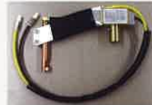
8 H-901 9 H-927*4