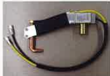
6 H-900 7 H-526*4