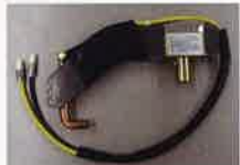
4 H-903+ 5 H-528*4