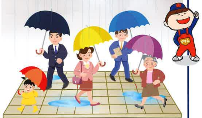
施工後は 耐久性に優れた 滑りにくい安全な状態