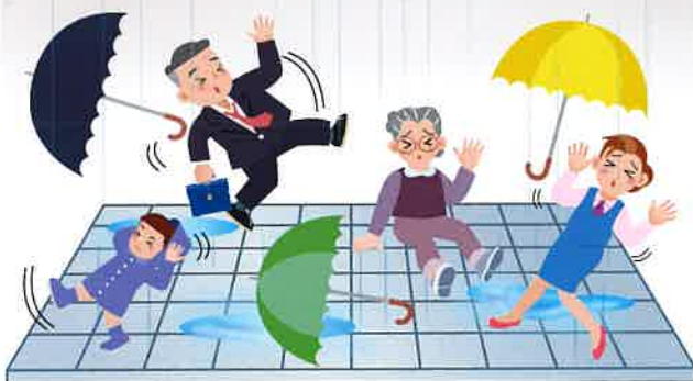
施工前は雨に濡れた床面が滑りやすい状態