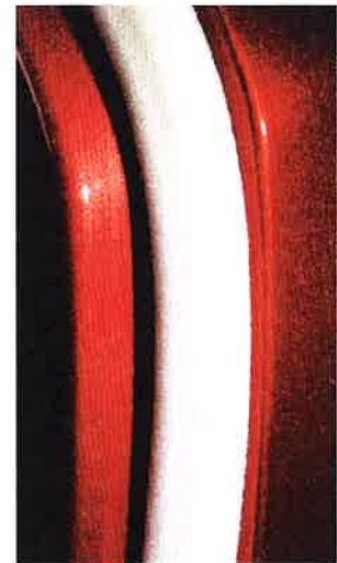
使用後のノリ残りを最小限に

型式 V-13 (径13mm 50m ロール 5m×10本) V-19 (径19mm 35m ロール 5m×7本) BOXサイズ: 幅17.0×高さ33.0×奥行33.0cm