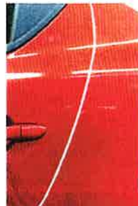
ミストをシャットアウト