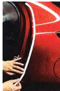
高密度スポンジ採用